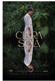
Info general (bios, premios, etc.)