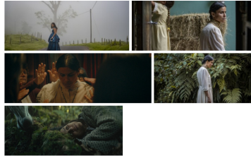
Stills de la película