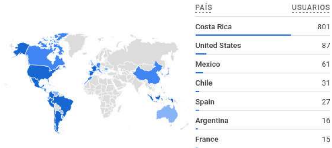
Figura 1. Estadísticas para el sitio WebTV durante dos periodos diferentes de tiempo enero a julio de 2023 y de julio a enero de 2024

Las estadísticas para el sitio webtv.fcs.ucr.ac.cr tuvo variaciones debido a los cambios realizados por la herramienta Google Analytics versión 4, por lo que se presentan dos periodos para el 2023, de enero a julio y de julio a enero de 2024.